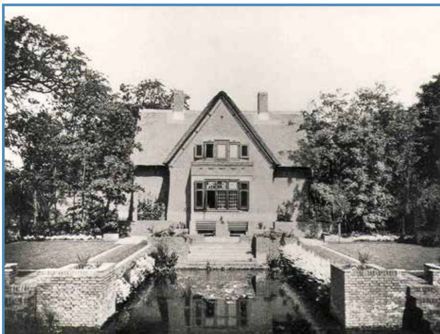
De lijnvoering van de muurtjes is verbonden met die van het huis. Ontwerp J.P. Fokker voor zijn huis te Wassenaar (1932).

Zo werden muurtjes rond 1900 geliefd als functioneel object maar vooral als hebbingetje in de tuinen van onze grootouders.