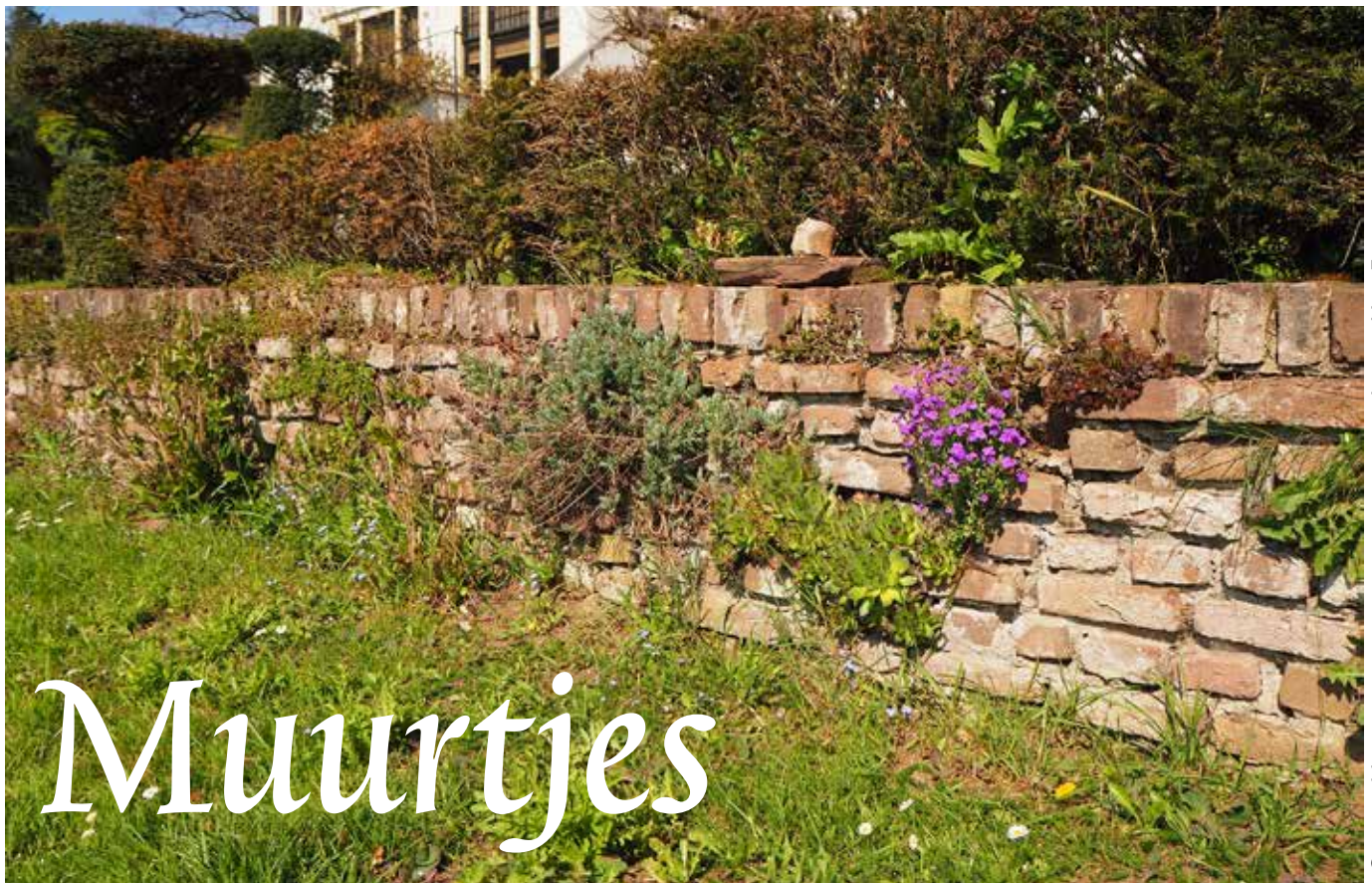
Gemetselde muur met uitsparingen voor muurplanten, Huis Empe te Empe (Gld).